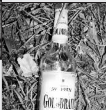
Am Tatort verlorener Ausweis des Opfers. Auch hier war Alkohol im Spiel, wie das rechte Bild zeigt