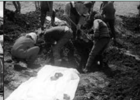
Exhumierung von bosnischen Muslimen

Zum gleichen Zeitpunkt gab es noch immer sporadische Kämpfe und militärische Operationen in Südserbien. Bewaffnete Kosovo-Albanische Gruppierungen operierten in diesem Gebiet seit dem Ende des Kosovo Krieges mit dem Ziel, das sogenannte „Presevo Tal“, in dem viele Albaner wohnen, zu „befreien“ und an Kosovo anzugliedern. Spezialkräfte der serbischen Polizei wurden in Südserbien stationiert, um die Sicherheit zu garantieren bzw. wiederherzustellen und gegen diese bewaffneten Gruppen vorzugehen. Aus diesem Grunde wurde zwischen der Provinz Kosovo und Südserbien eine sogenannten 5-km Puffer Zone eingerichtet, die aus Sicherheitsgründen niemand betreten durfte.