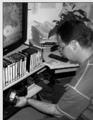
Auch bei Durchsuchungen im Zusammenhang mit politisch motivierten Straftaten, sowohl linker wie auch rechter Orientierung, beschlagnahmte Videos müssen auf einen verfassungsfeindlichen Inhalt hin geprüft werden

werden Straftaten zugeordnet, wenn in Würdigung der Umstände der Tat und/oder der Einstellung des Täters Anhaltspunkte dafür vorliegen, dass sie nach verständiger Betrachtung (z.B. nach Art der Themenfelder) einer „rechten“ Orientierung zuzurechnen sind, ohne dass die Tat bereits die Außerkraftsetzung oder Abschaffung eines Elementes der freiheitlichen demokratischen Grundordnung (Extremismus) zum Ziel haben muss. Insbesondere sind Taten dazuzurechnen, wenn Bezüge zu völkischem Nationalismus, Rassismus, Sozialdarwinismus oder Nationalsozialismus ganz oder teilweise ursächlich für die Tatbegehung waren. Diese politisch motivierten Straftaten sind als rechtsextremistisch zu qualifizieren.