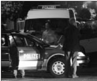
Skinheadkonzerte – eine polizeiliche Herausforderung