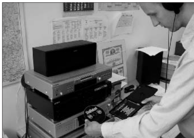
Ein Auswerter im Sachgebiet Rechtsextremismus am LKA Brandenburg prüft, ob die Texte der CD volksverhetzend, gewaltverherrlichend oder rechtsextremistischen Inhalts sind

Der politisch motivierten Kriminalität werden Straftaten zugeordnet, wenn in Würdigung der Umstände der Tat und/oder der Einstellung des Täters Anhaltspunkte dafür vorliegen, dass sie den demokratischen Willensbildungsprozess beeinflussen sollen, der Erreichung oder Verhinderung politischer Ziele dienen oder sich gegen die Realisierung politischer Entscheidungen richten, sich gegen die freiheitliche demokratische Grundordnung bzw. eines ihrer Wesensmerkmale, den Bestand und die Sicherheit des Bundes oder eines Landes richten oder eine ungesetzliche Beeinträchtigung der Amtsführung von Mitgliedern der Verfassungsorgane des Bundes oder eines Landes zum Ziel haben, durch Anwendung von Gewalt oder darauf gerichtete Vorbereitungshandlungen auswärtige Belange der Bundesrepublik