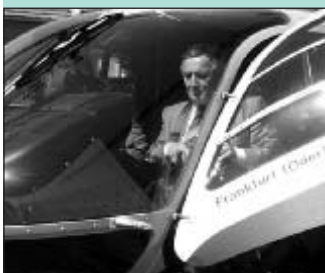
Polizeihubschrauber EC 135 in Dienst gestellt