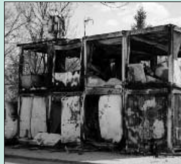
Ausgebrannte Bürocontainer des Speziellen Ermittlungsteams nach dem Angriff auf die IPTF Station

Im November 2000 besiegelte die Bevölkerung Jugoslawiens auf friedlichem Wege und mit Demonstrationen das Ende des Milosevic Regimes. Dies stellte für den gesamten Balkan eine entscheidende Wende dar. Eine der ersten notwendigen Maßnahmen war die Durchführung freier und demokratischer Wahlen. Dies fiel, auf Grund der Umstände, in den Zuständigkeitsbereich der OSZE-ODIHR Mission, die sofort eröffnet wurde und ihre Arbeit aufnahm.