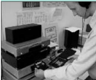
Polizeiliches Definitionssystem „PMK“