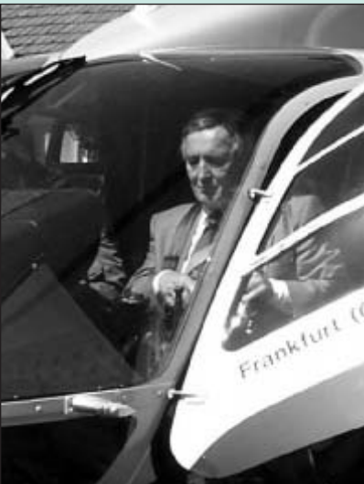
Bild oben: Staatssekretär Eike Lancelli an Bord einer der beiden Polizeihubschrauber, die er zusammen mit den Piloten der Hubschrauberstaffel vom Hangar in Diepensee nach Potsdam-Eiche überführte