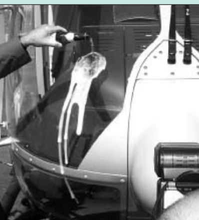
Bild unten: Innenminister Jörg Schönbohm taufte beide Hubschrauber und betonte dabei, dass Hubschrauber in einem so großen Flächenland wie Brandenburg ein unverzichtbares Einsatzmittel sowohl für die Verkehrsüberwachung wie auch für die Kriminalitätsbekämpfung darstellen