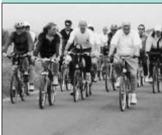
Polizisten „auf Tour“